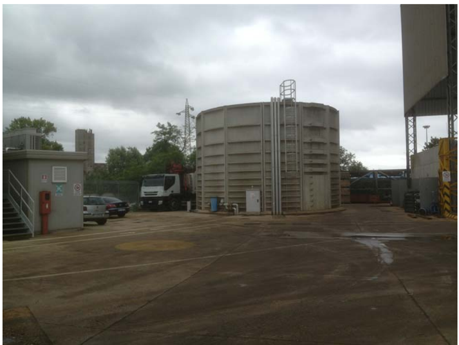
FOTO 3 - CONO DI VISUALE VERSO NORD (vasca stoccaggio acque meteoriche)