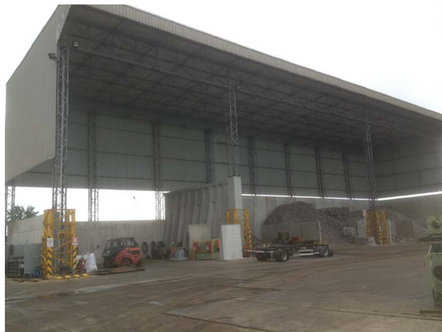
FOTO 4 - CONO DI VISUALE VERSO NORD-EST/EST (tettola stoccaggio rifiuti)