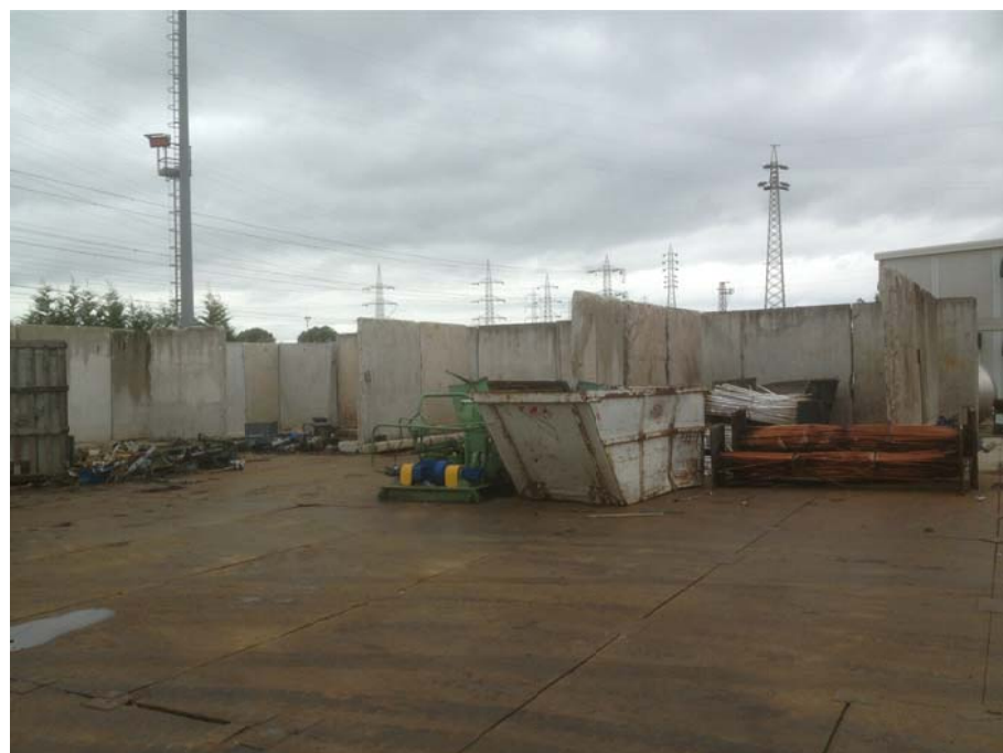
FOTO 6 - CONO DI VISUALE VERSO SUD-EST (interno area, zona stoccaggi)