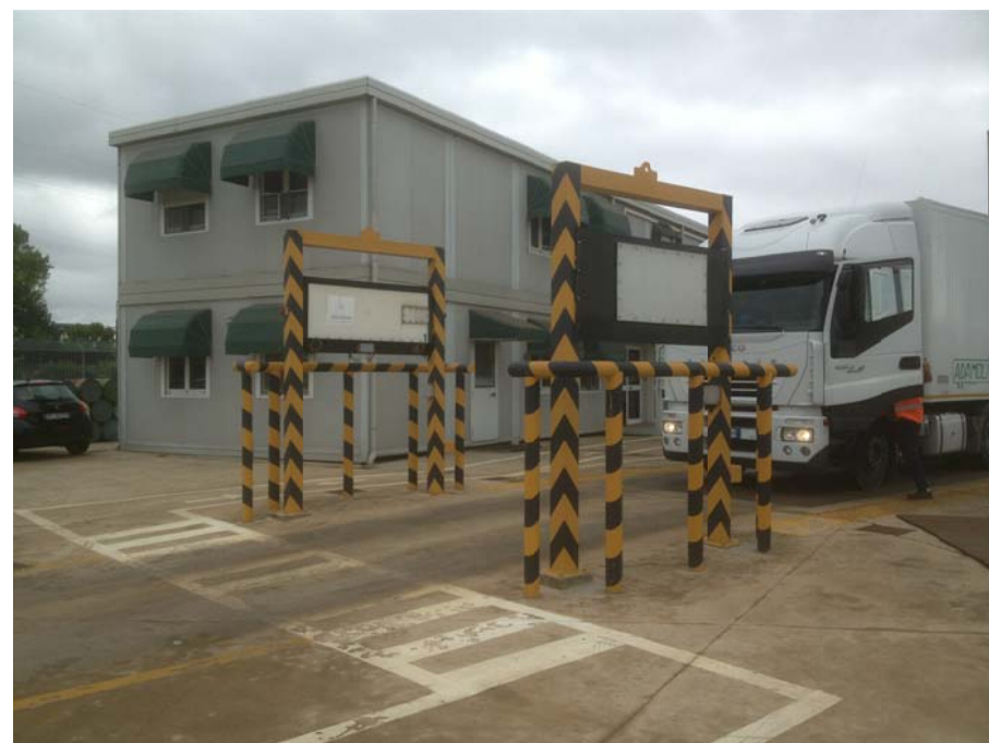
FOTO 2 - CONO DI VISUALE VERSO NORD-OVEST (portale rilevazione radioattività)