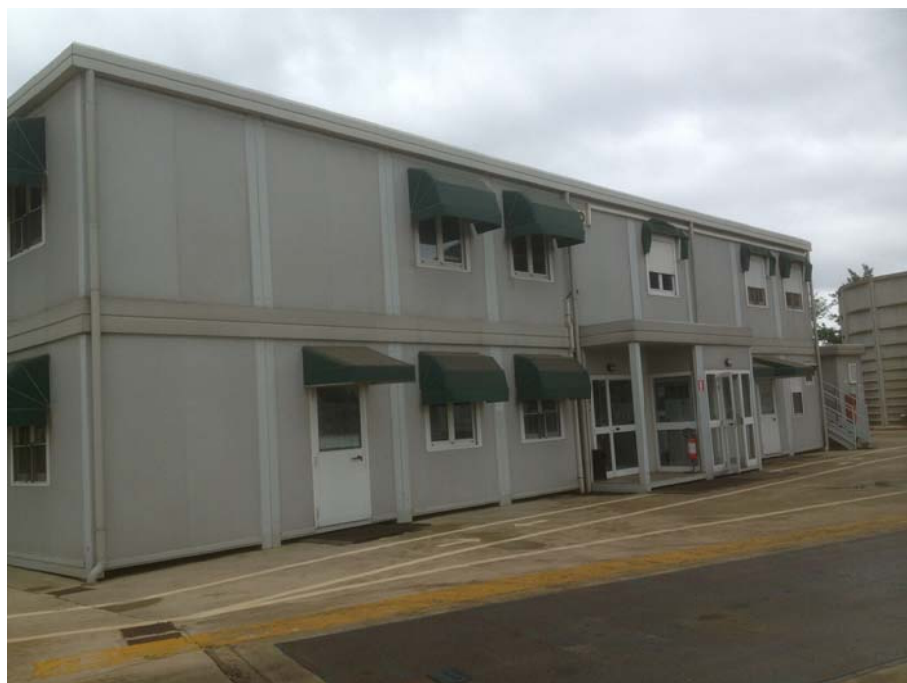
FOTO 1 - CONO DI VISUALE VERSO NORD/NORD-OVEST (palazzina uffici e servizi)