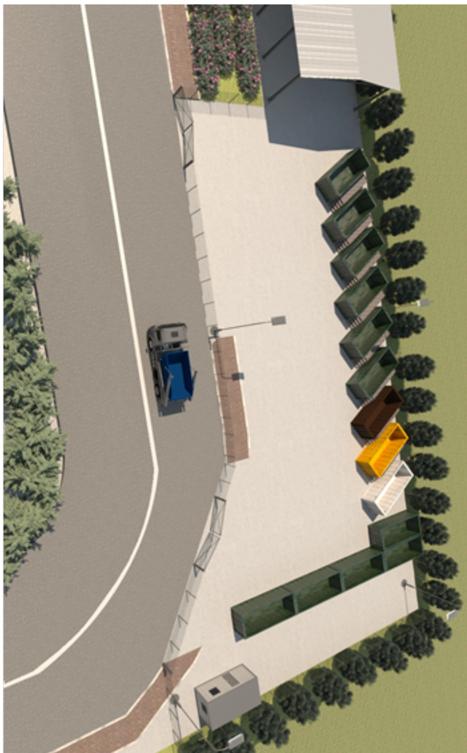
Immagine 1. Veduta ECOCENTRO