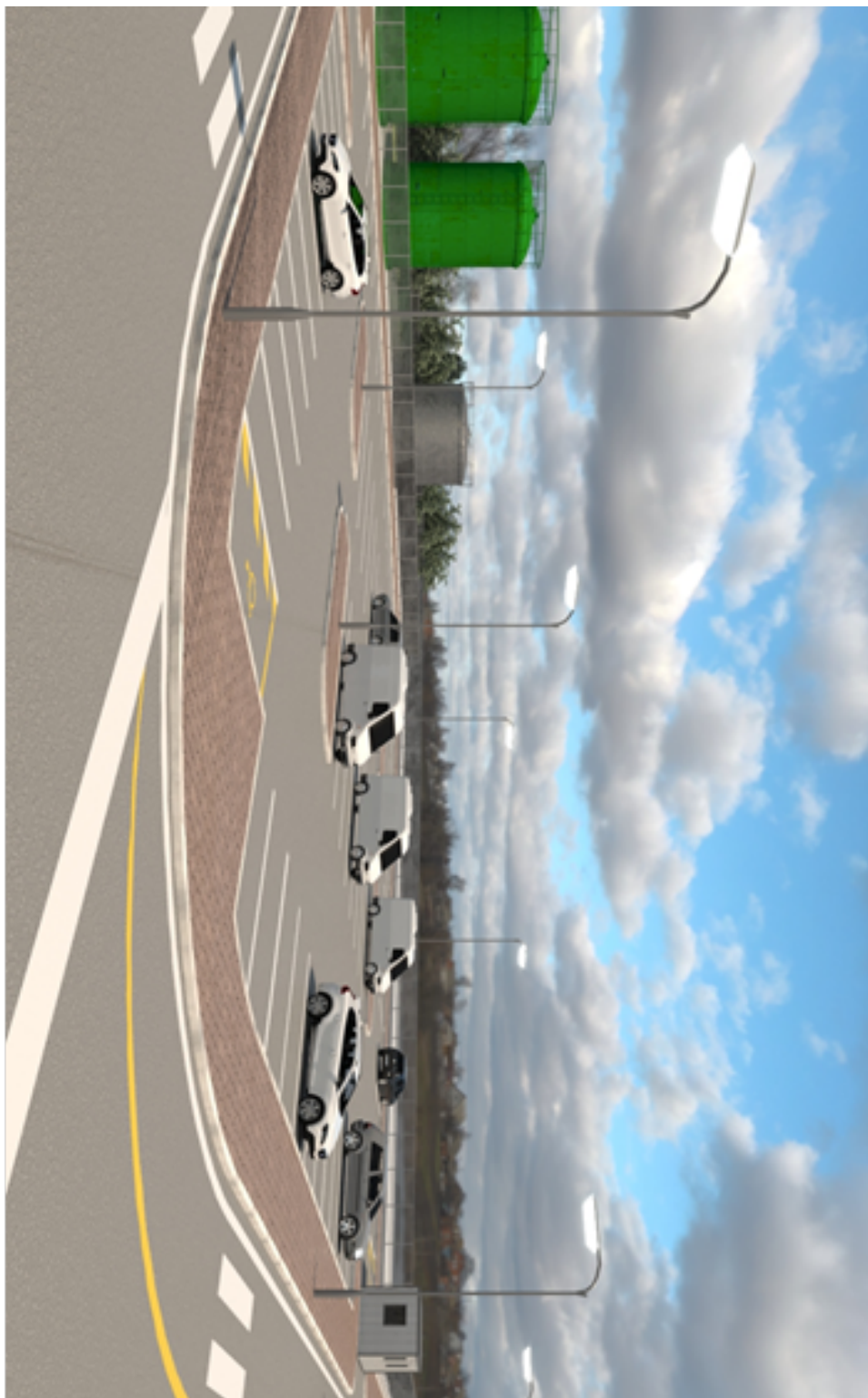
Immagine 5. Veduta parcheggio di attesa lato NORD