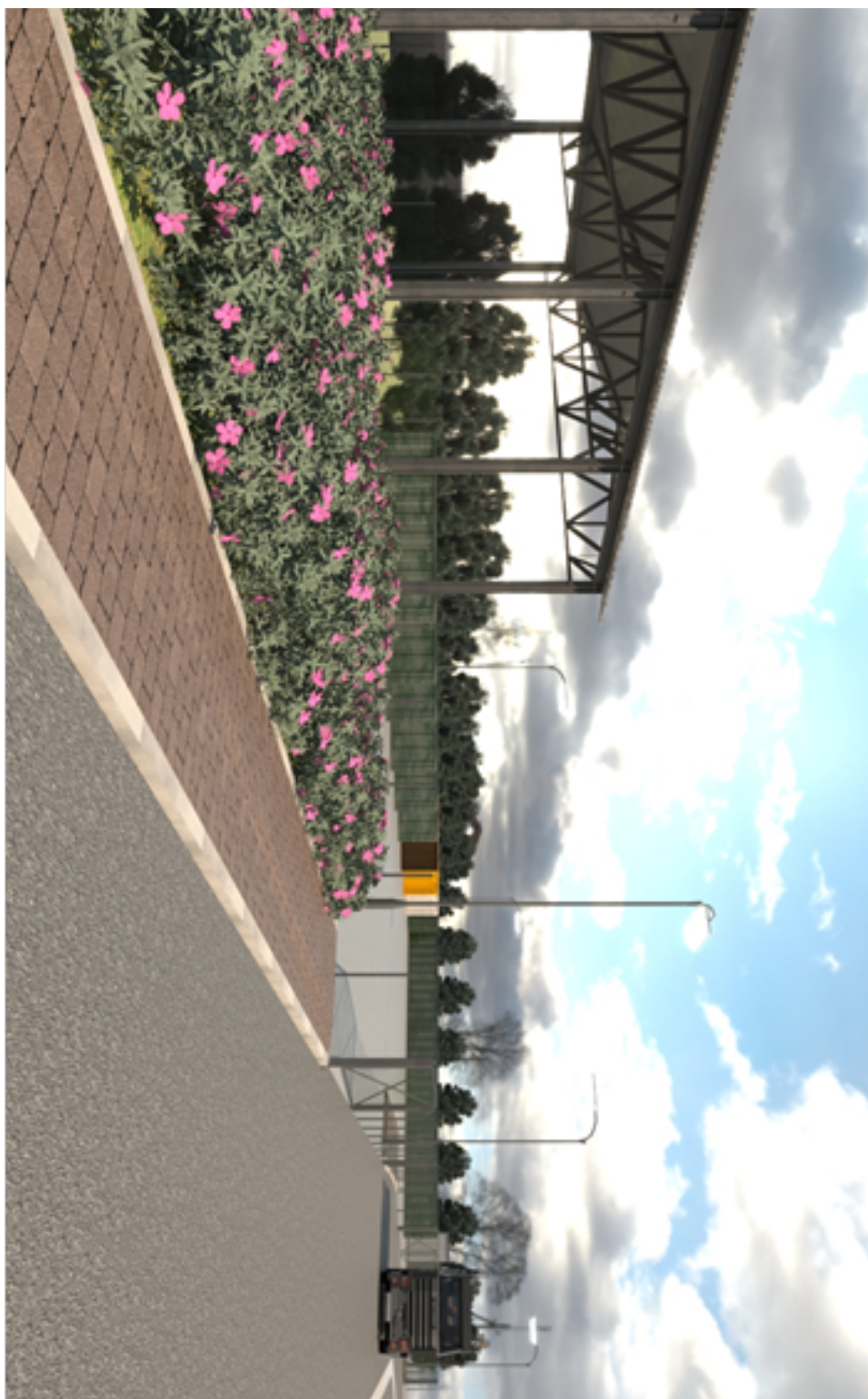
Immagine 2. Veduta ECOCENTRO lato SUD