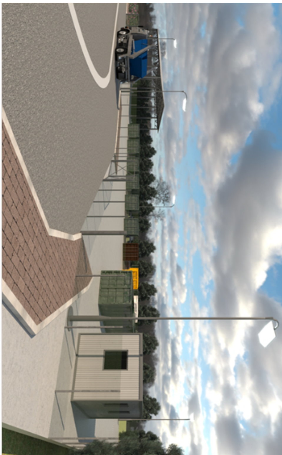
Immagine 3. Veduta ECOCENTRO lato NORD